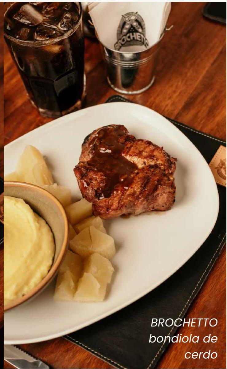
BROCHETTO bondiola de cerdo