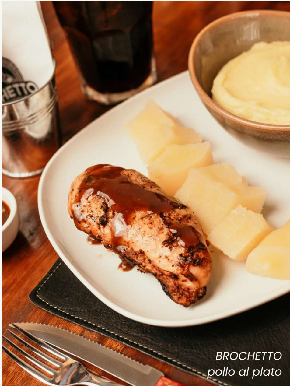
BROCHETTO pollo al plato