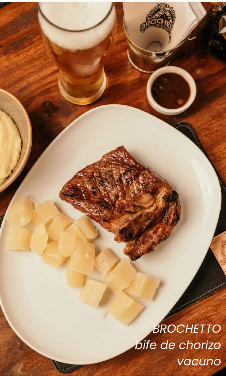
BROCHETTO bife de chorizo vacuno