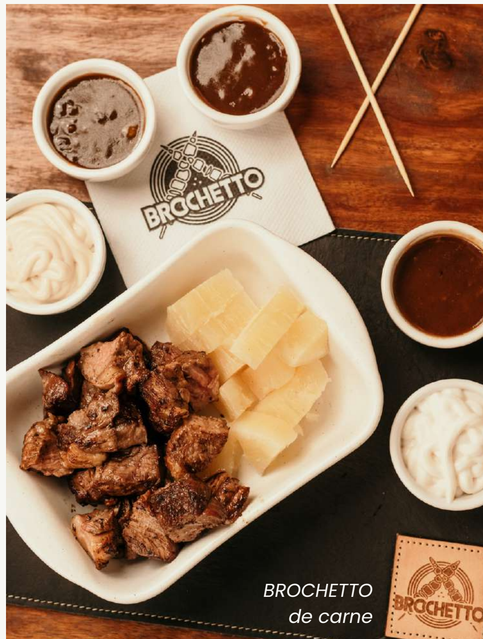
BROCHETTO de carne