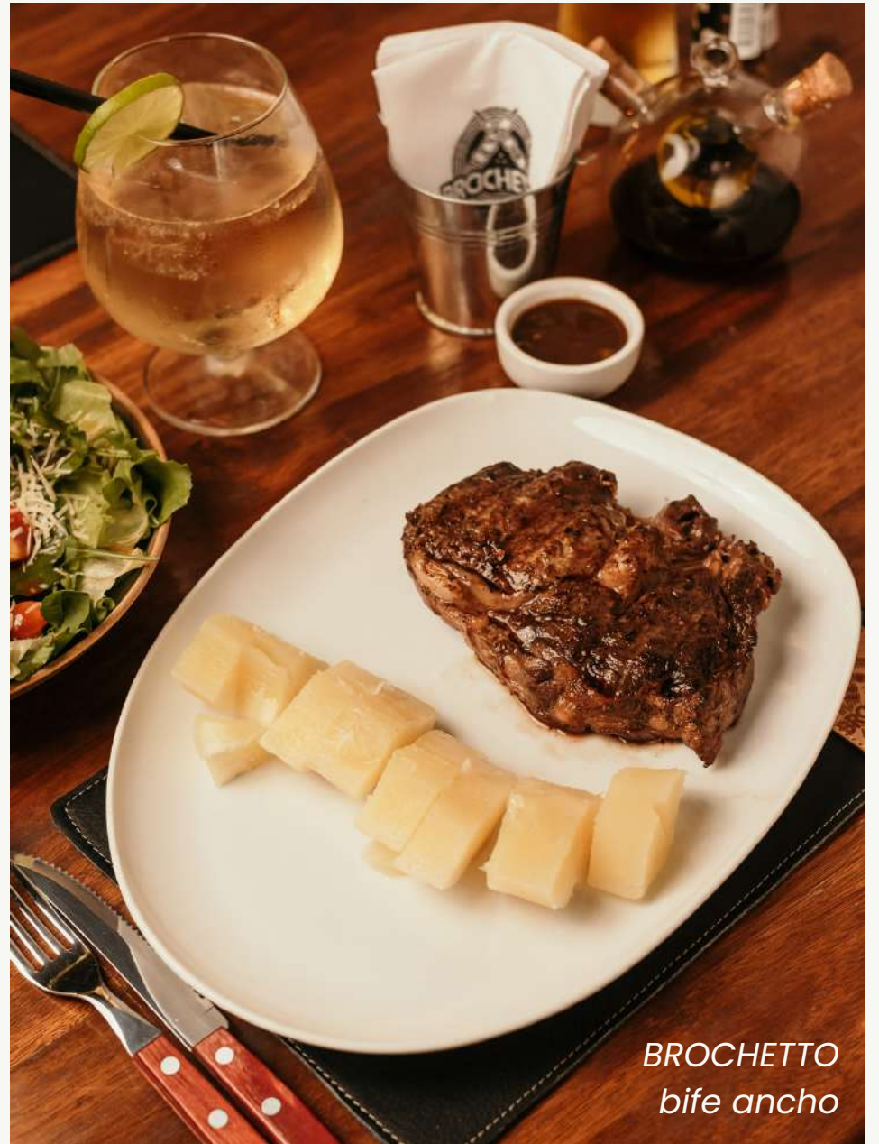
BROCHETTO bife ancho