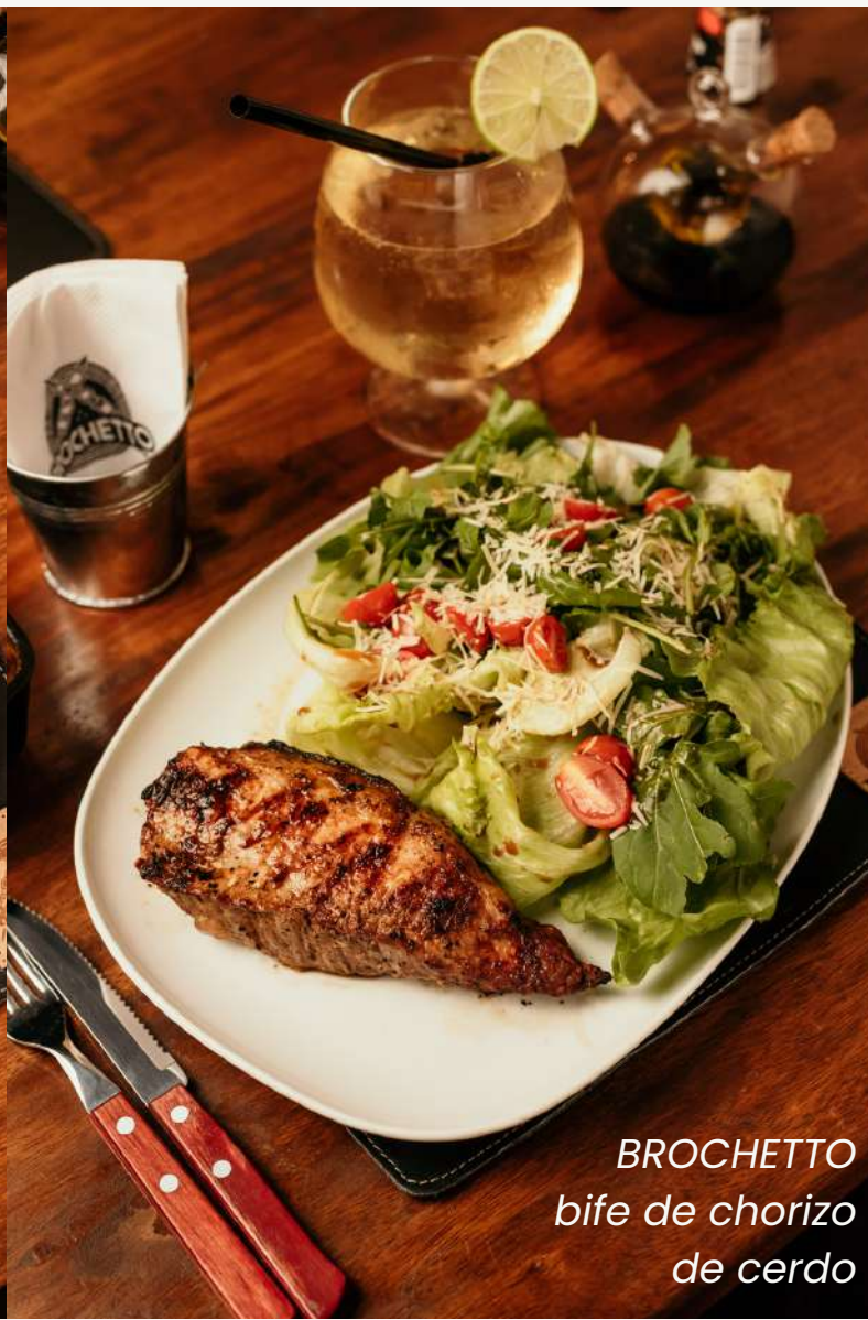
BROCHETTO bife de chorizo de cerdo