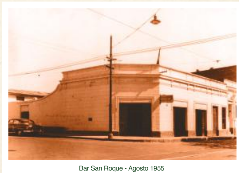
Bar San Roque - Agosto 1955