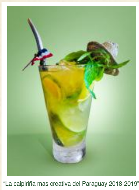
"La caipiriña mas creativa del Paraguay 2018-2019"

Fernet con coca cola en vaso.....Gs. 25.000