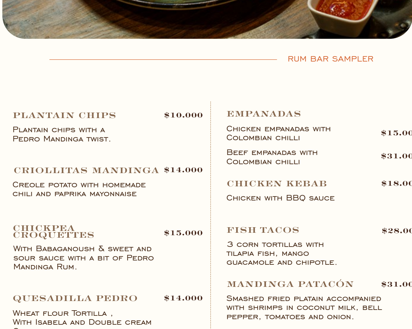
RUM BAR SAMPLER