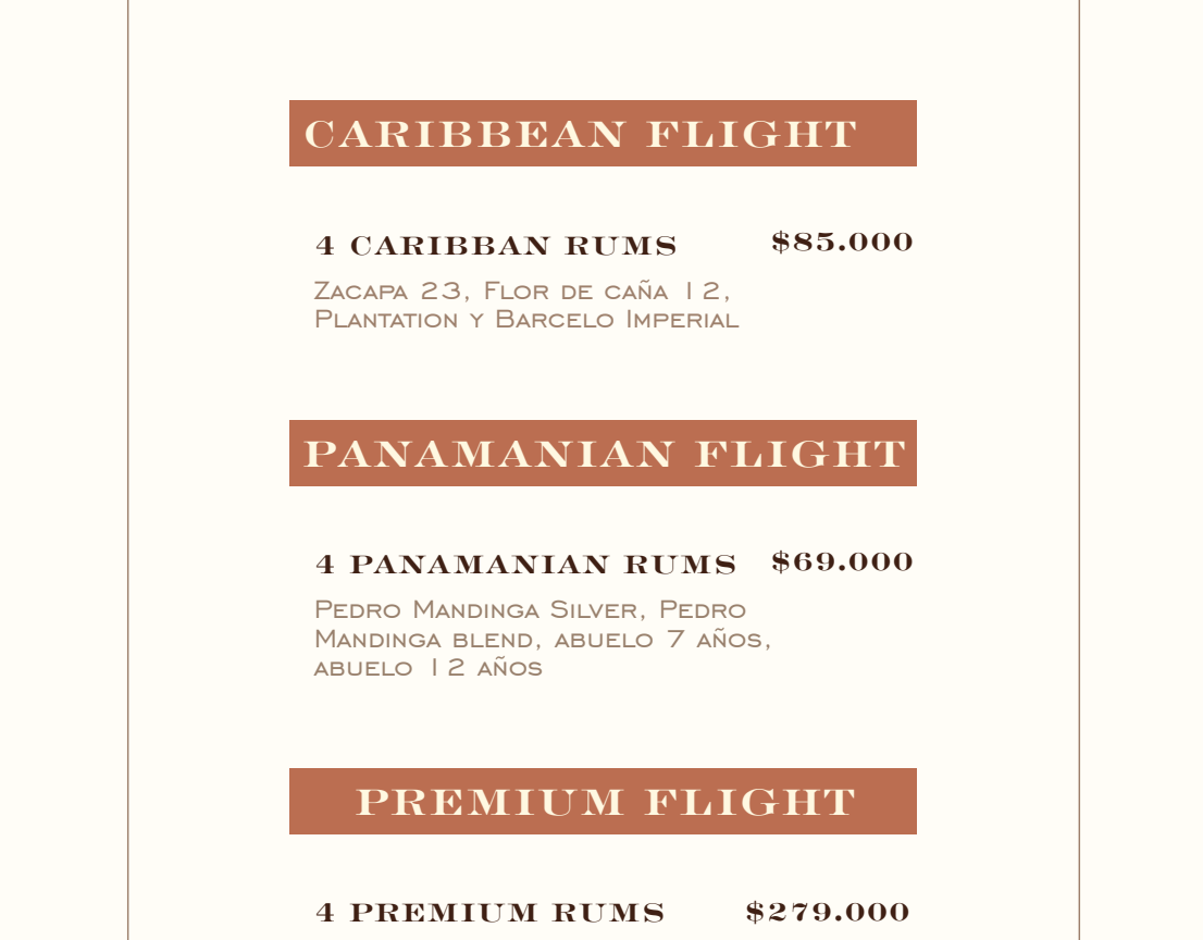
PEDRO MANDINGA BLEND