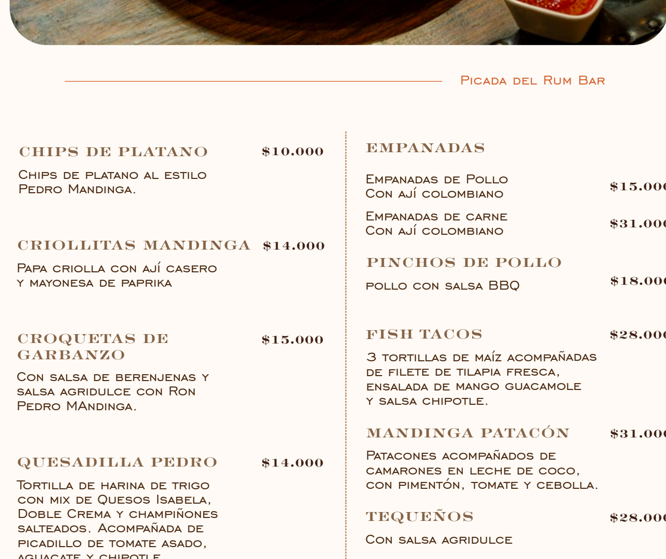
PICADA DEL RUM BAR