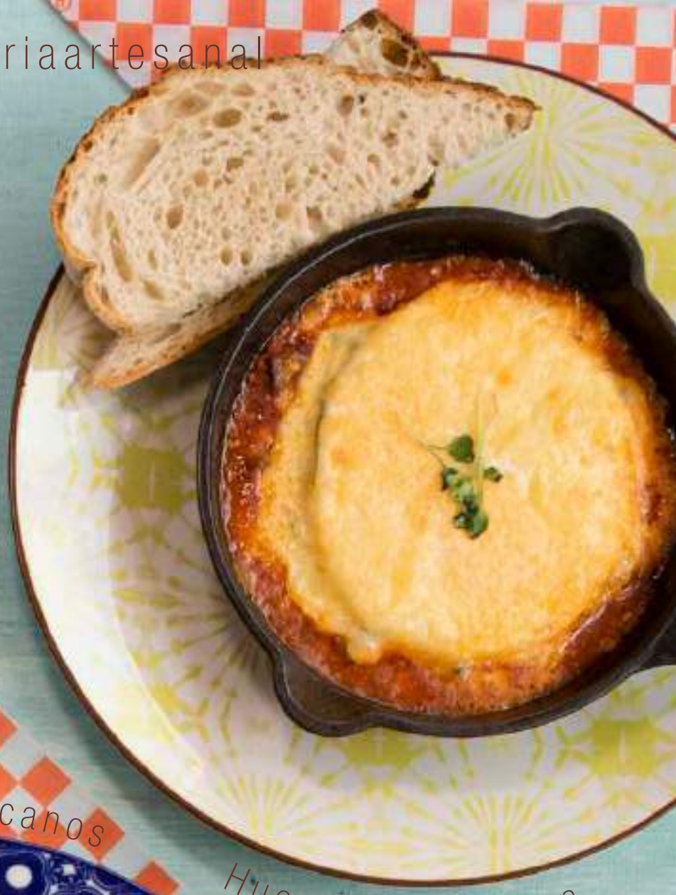
Huevos Mia Nonna