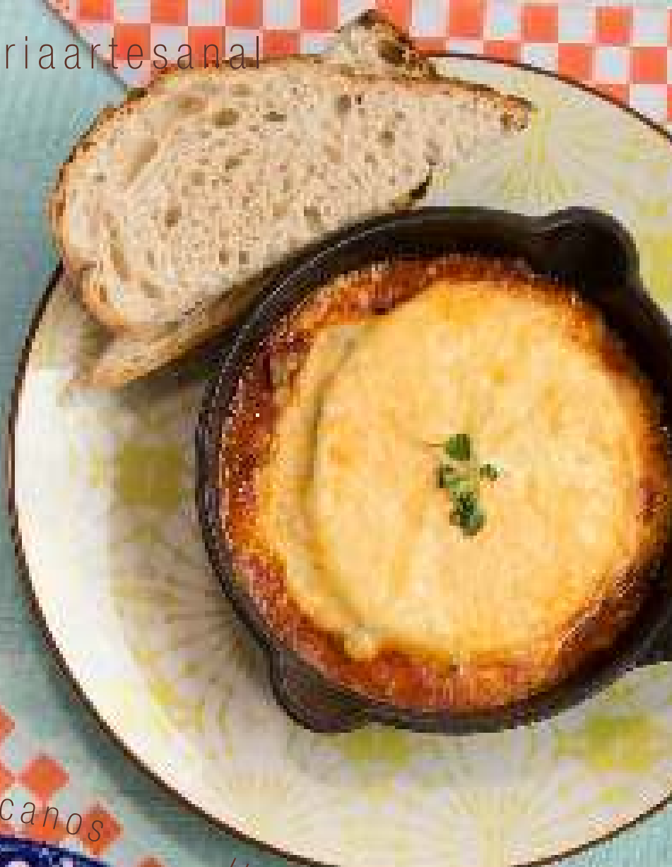
Huevos Mia Nonna