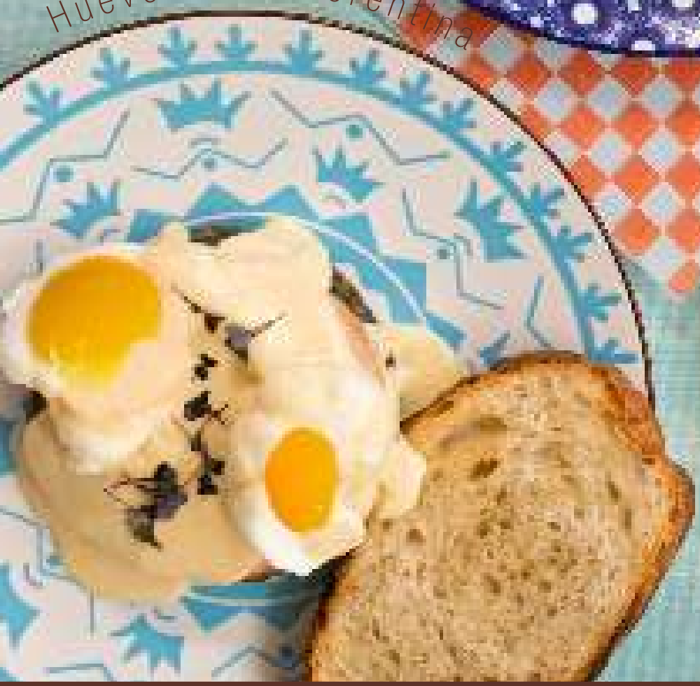
Huevos Alla Fiorentina