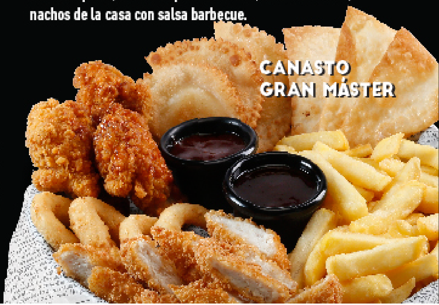
CANASTO GRAN MÁSTER

Canasto con una gran variedad de deliciosos acompañamientos: crujientes papas fritas, alitas de pollo barbecue, empanaditas de queso, trozos de pollo crocante, aros de cebolla, nachos de la casa con salsa barbecue.