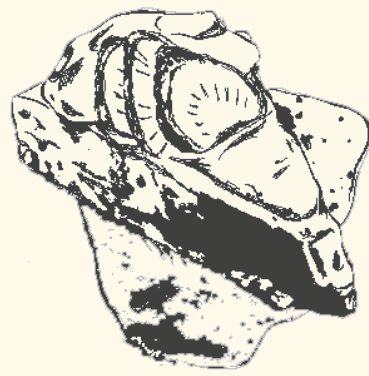
Cheesecake de té matcha

Donut de té matcha y flor de Jamaica . . . . . $12.500 Torta de chocolate, caramelo de miso, vainilla . . . . . $18.500 Pannacotta de té chai, cubitos de té negro, tierra de sal . . . . . $18.500 Cheesecake de té matcha . . . . . $18.500