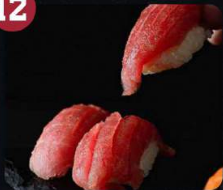
NIGIRI MAGURO / DE ATÚN