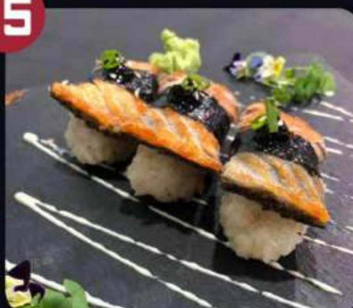
SAKE SKIN NIGIRI