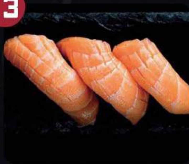
NIGIRI SAKE / DE SALMÓN