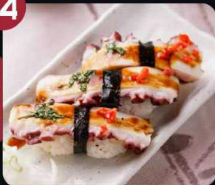
NIGIRI DE PULPO