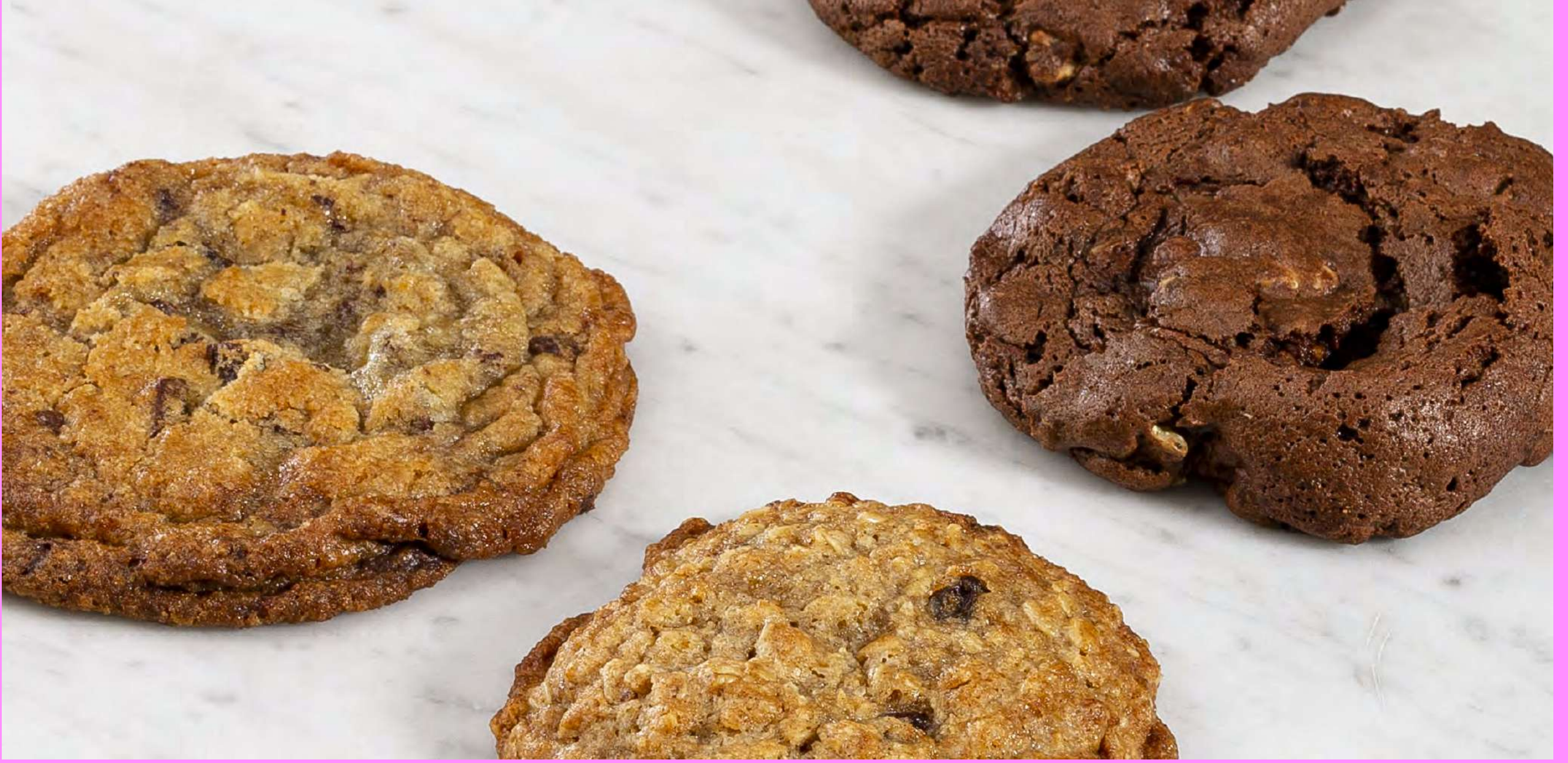
Galletas Chunks de Chocolate / Choco-Choco