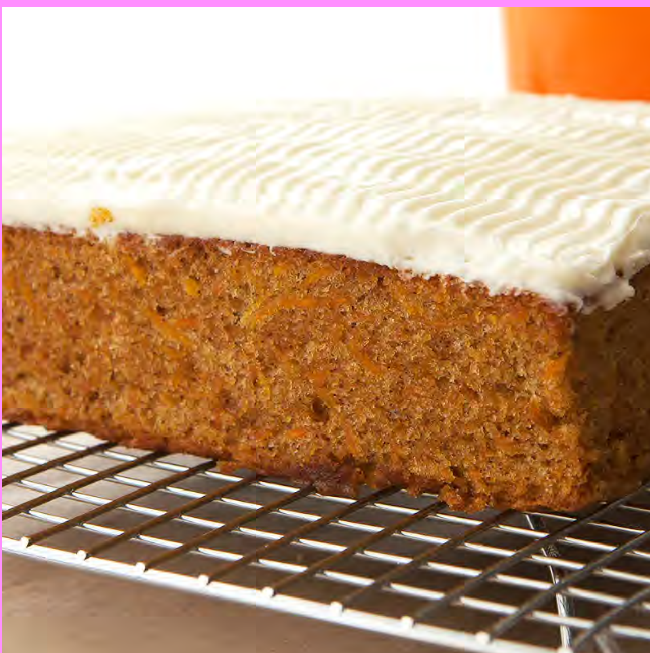
Torta de Zanahoria $13.000 (Porc.)