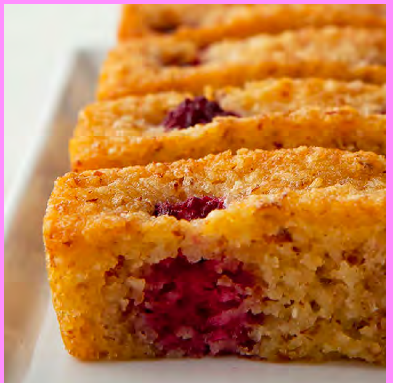
Galleta Financier $5.000