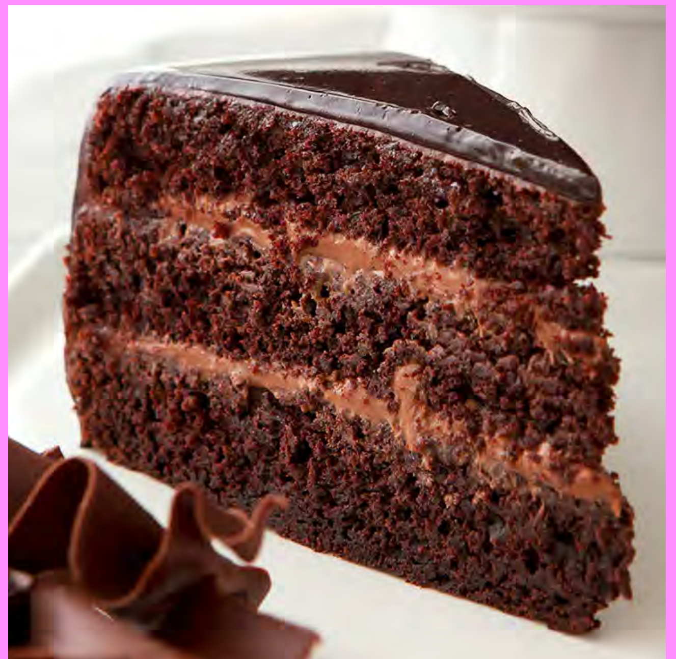
Torta de Chocolate $13.000 (Porc.)