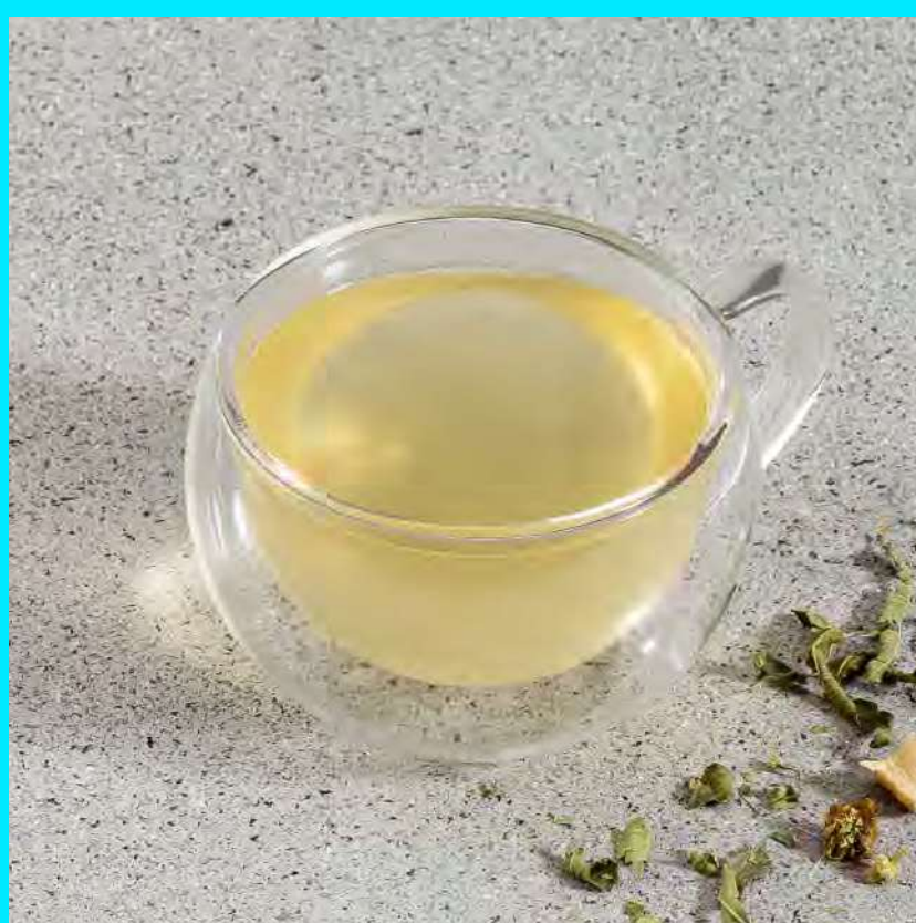
Té en Agua $7.000