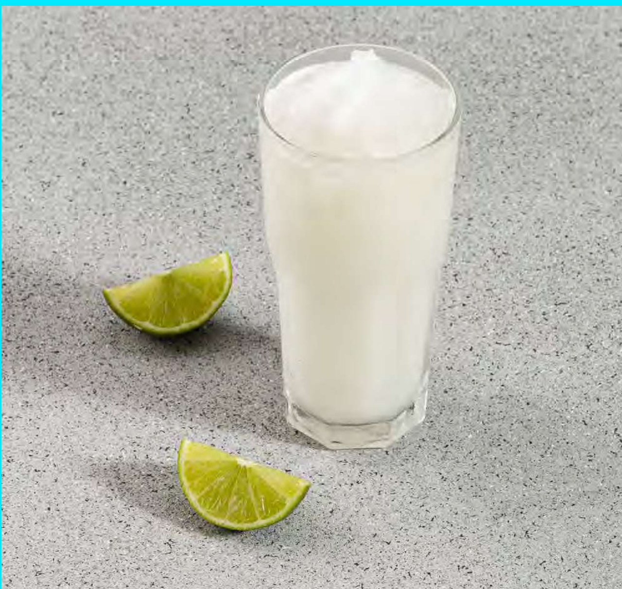
Limonada Natural $5.000