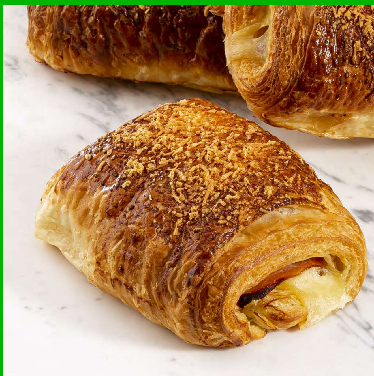
Croissant de Jamón y Queso (Mini) $6.000