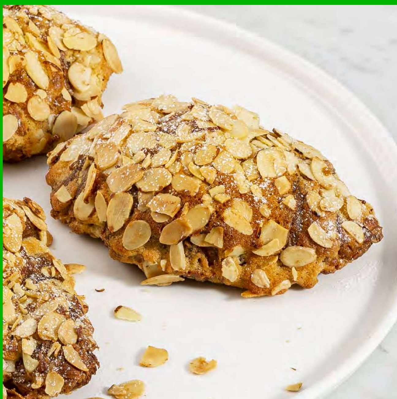
Croissant de Almendras $9.000