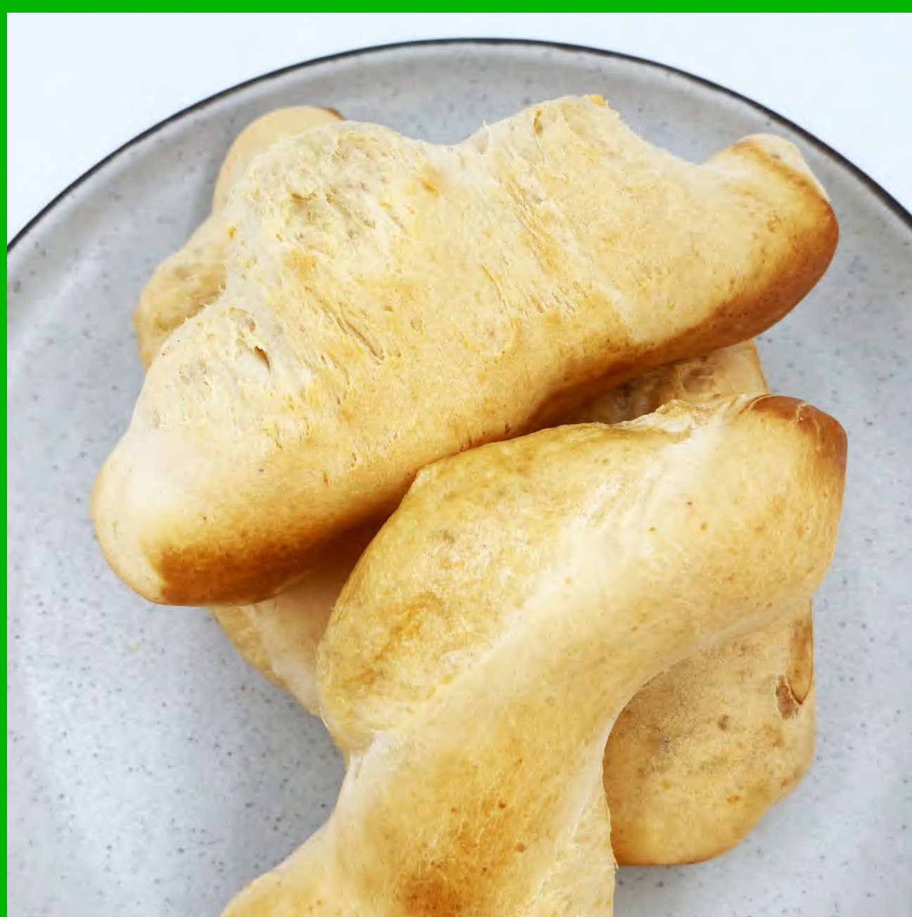
Pan de Yuca $5.000