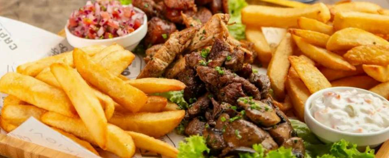
TABLA PARA COMPARTIR