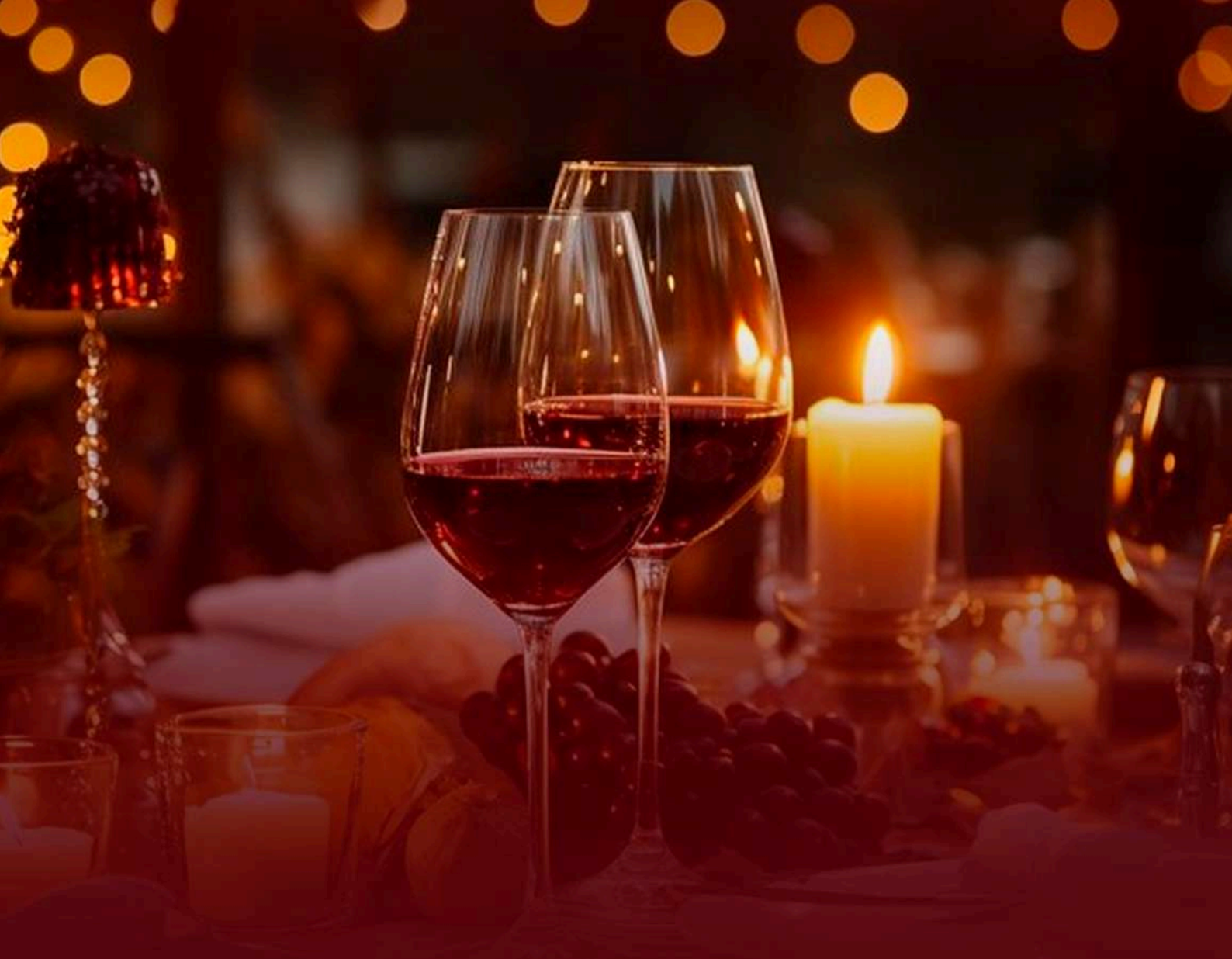
TABLA PARA COMPARTIR